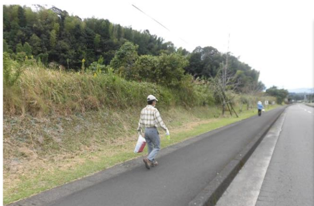
長く続く道路をせつせと..