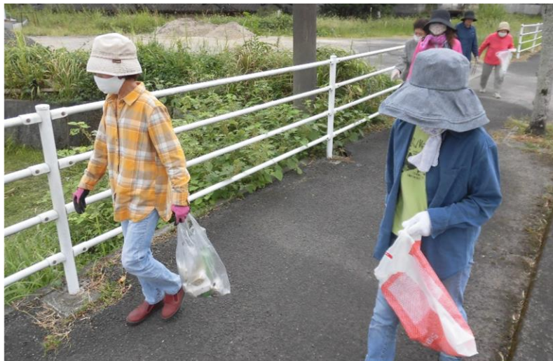
ここはシルバー人材センター前の道路です。