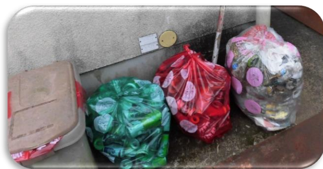
キレイに見える道路も、 こんなにゴミがありました！

10月9日(金) 福祉家事群のボランティア活動を実施しました。シルバー人材センターを拠点として、ふれあい橋方面とふれあいセンター方面の二手に分かれ、直線距離およそ 3.3kmを会員 12 名で清掃しました。さわやかな秋風の中、日ごろの感謝を込めて作業をして、とても綺麗になりました。